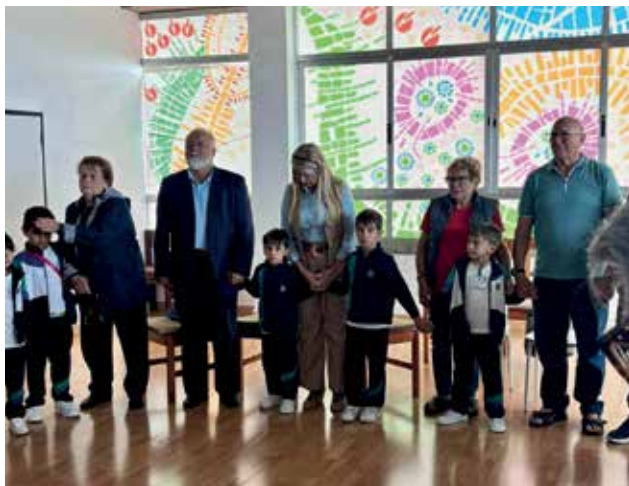
Oratorio con los abuelos en Los Realejos. Con alumnos de Educación Infantil de 5 años. Encuentro lleno de cariño.