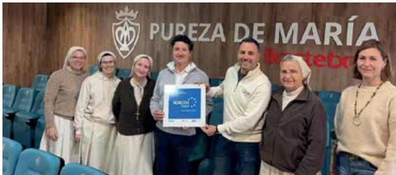
Bilbao, 'Future Ready School'. El colegio recibió de la empresa Robotix este diploma por el uso educativo de la plataforma Robotix C360 para robótica y programación.