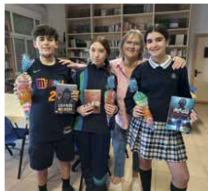
Concurso de cómic y 'lettering' por el Día de Madre Alberta en Granada. Un momento de la entrega de premios del certamen.