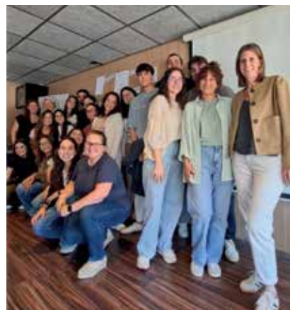
'Somos Pureza'. Jornadas de formación de nuevos profesores profesores en Madre Alberta.