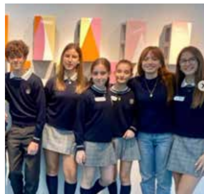
Diferentes aspectos de la celebración y viaje a Zaragoza del equipo de Madrid.