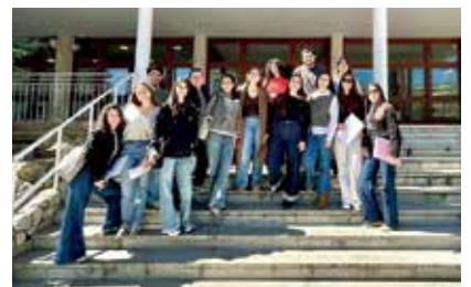
Los alumnos del Doble Grado de Educación, en Madre Alberta.