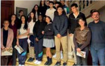
Imagen de grupo en el Ayuntamiento de Manacor.