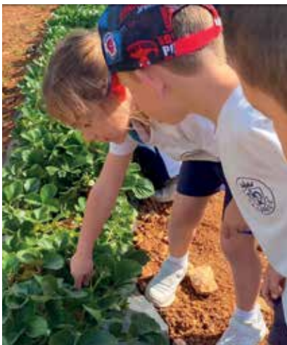
Manacor, visita a s'Hort de sa Vall. En Infantil, para descubrir de dónde vienen los alimentos y cómo se cultivan.