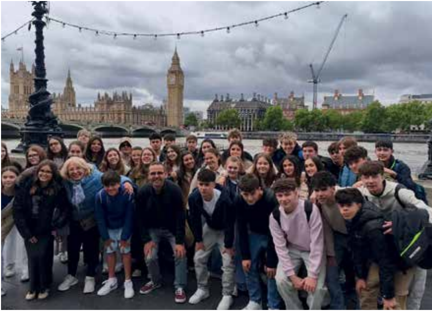
'Ministay' Salisbury de 2º y 3º de ESO de Pureza Inca. Una maravillosa experiencia con este viaje al Reino Unido, que ha dejado grandes risas entre compañeros y recuerdos imborrables.