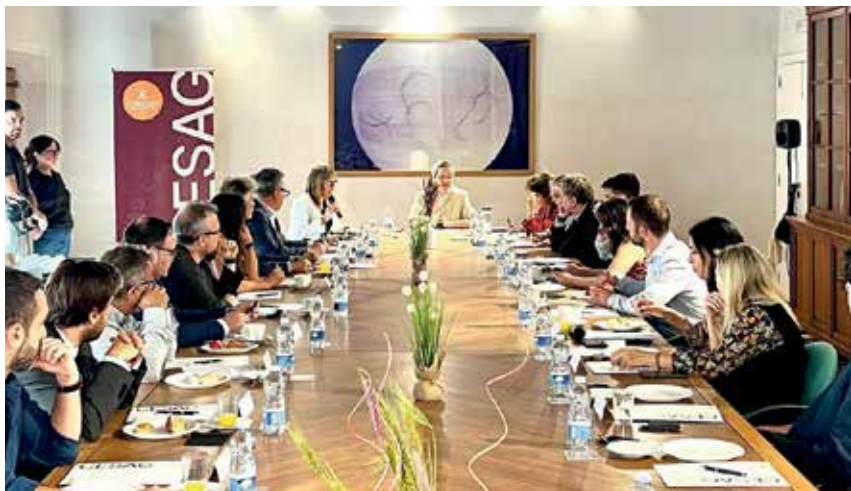
CESAG, coloquio universidad–empresa sobre el futuro de la comunicación. Reuniendo el 20 de mayo a representantes del tejido empresarial de Baleares para dialogar sobre los nuevos retos del sector y qué se espera de sus profesionales.