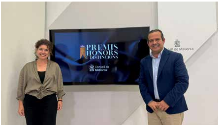
Premio Jaume II del Consell de Mallorca para el Colegio Madre Alberta. El colegio recibirá este septiembre un reconocimiento por su «destacada labor educativa», que lo ha convertido en centro de referencia. En la imagen, anuncio del premio el 22 de mayo.