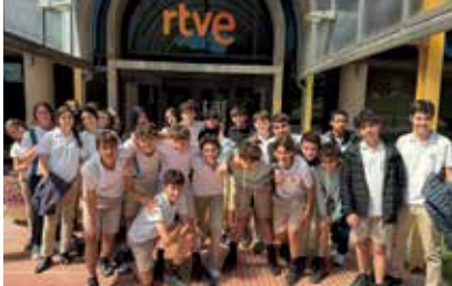
Alumnos de Sant Cugat en la visita al museo de RTVE.