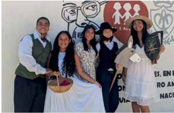
Teatro en inglés en San Luis, Cumaná. Los estudiantes venezolanos de quinto de Química Industrial cambiaron los laboratorios en mayo por el escenario. Recrearon en inglés clásicos como ‘Titanic’, ‘Romeo y Julieta’ y ‘Orgullo y prejuicio’.