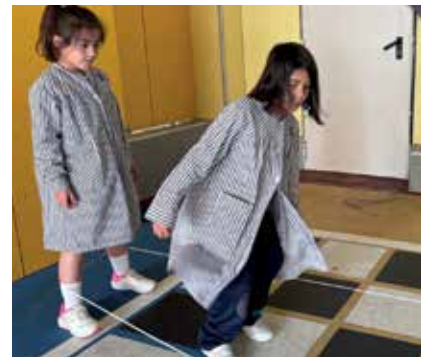
Grao, juegos tradicionales en Enigmat. Para alumnos de 3º de Primaria.