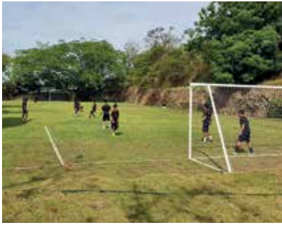
Panamá, nuevo campo de fútbol. Este abril, para seguir formando en comunidad.