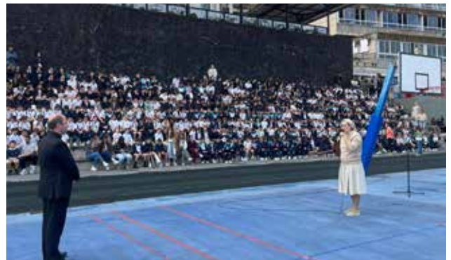
Otro instante de la visita del 28 de abril, y en la imagen inferior, con los alumnos confirmados el 8 de mayo.