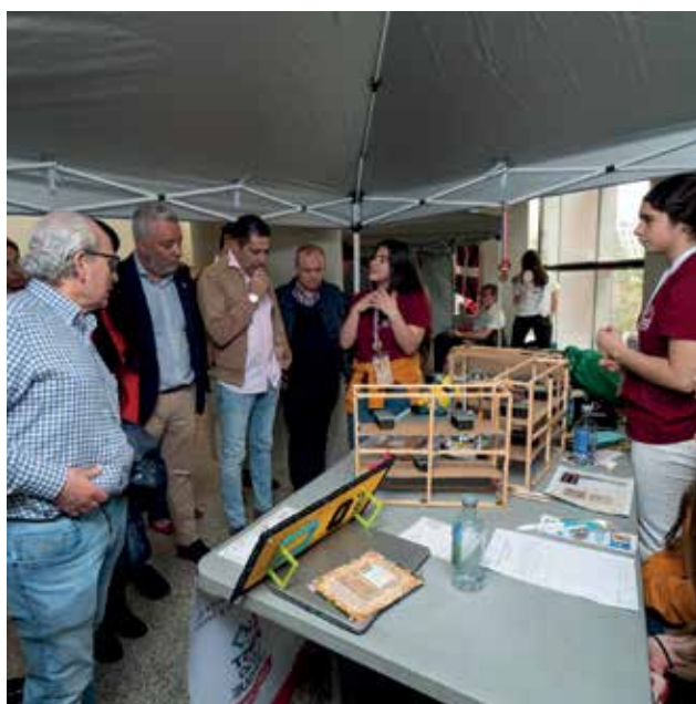
Imágenes del equipo de robótica de Pureza La Cuesta y de la final nacional de la First Lego League España.