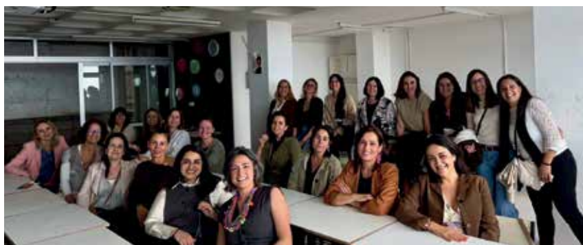
Reencuentro en Los Realejos. De las antiguas alumnas de la generación de 1983, que celebraron el 25 aniversario de su paso por el colegio.