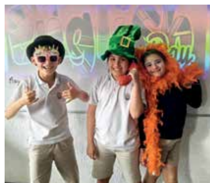
English Day en Bibao. Con juegos y bailes y canciones.