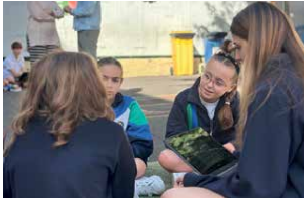
Con el rosario en los talleres 'With Faith' de Santa Cruz. El alumnado de 3º de ESO realizó una actividad con 1º y 3º de Primaria para enseñarles qué es el rosario y cómo rezarlo. A través de un cuento y de una explicación sencilla, rezaron juntos.