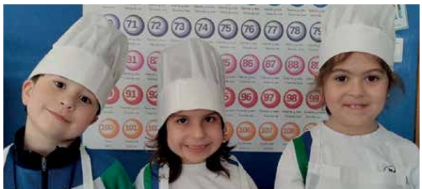
Grao: aprendiendo en inglés sobre cocina y gastronomía. Con el objetivo de fomentar la competencia comunicativa en lengua inglesa las aulas de 1º de Primaria se han convertido en un restaurante de alto nivel. A través del role-play los alumnos han puesto en práctica de forma real lo aprendido en el aula.