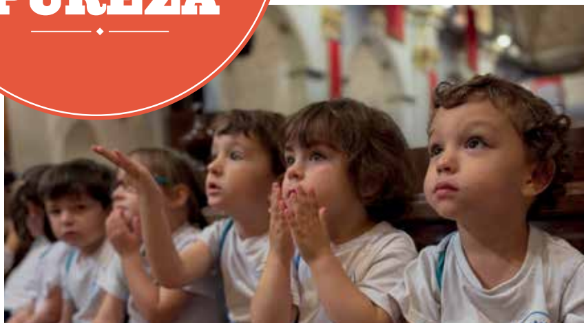
Peregrinación a Santa María en Ontinyent. Para dar gracias por todo lo vivido este curso y en el Mes de María.