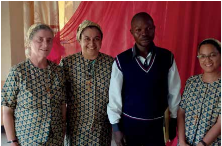
Misa de clausura del cincuentenario de la Pureza en África. En la fiesta del 23 de abril, en el Lycée Mahidio de Kamina, una ocasión para recordar y agradecer varias fechas clave de la congregación.