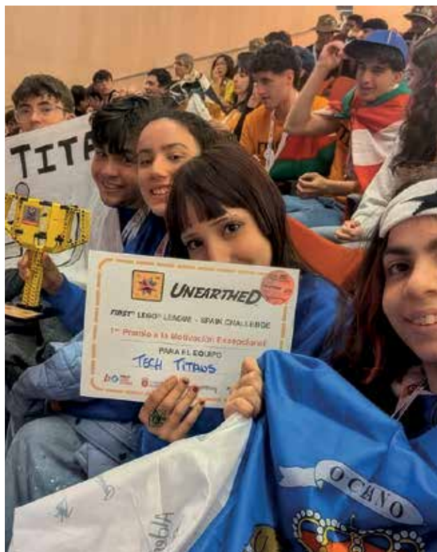
Redacción MP. La Cuesta.

El equipo de robótica de Pureza de María La Cuesta Tech Titans ha sido reconocido en la final nacional de la First Lego League con el Primer Premio a la Motivación Excepcional, celebrada el pasado 11 de abril en Burgos. Un reconocimiento que pone en valor algo básico: la actitud, la ilusión y el trabajo en equipo.