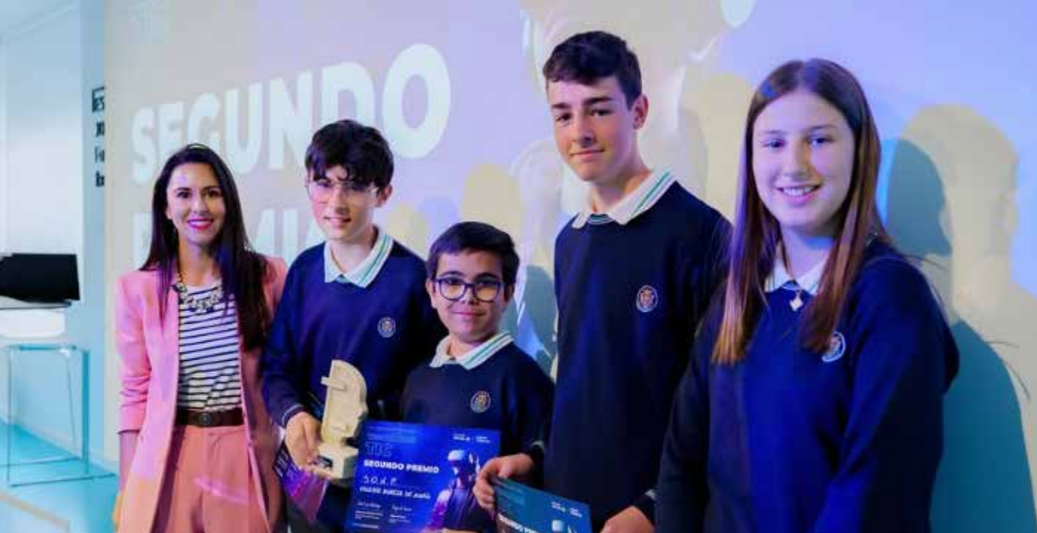
Los premiados reunidos a principios de mayo en el Espacio Joven de Fundación Ibercaja .