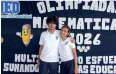
En la imagen, los dos estudiantes de Secundaria de Managua premiados.