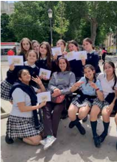
Granada: taller de grabado. Una actividad diferente para celebrar el Día del Libro en el grupo A de 2º de ESO.