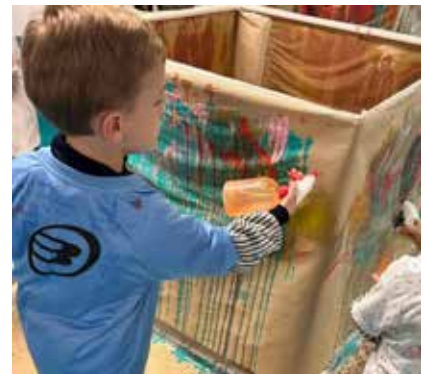
Talleres Wow en 3 años de Madrid. Experimentado con técnicas de arte como el manchado y la creatividad con objetos cotidianos.