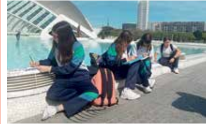
Momento del recorrido de aprendizaje en Valencia.