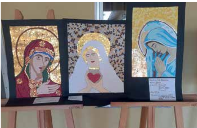
Práctica de mosaico con arte bizantino en Panamá. A cargo de estudiantes de décimo grado de Pureza de María, en la asignatura de Bellas Artes, donde realizaron una práctica de la técnica del mosaico inspirándose en el tradicional arte religioso bizantino.