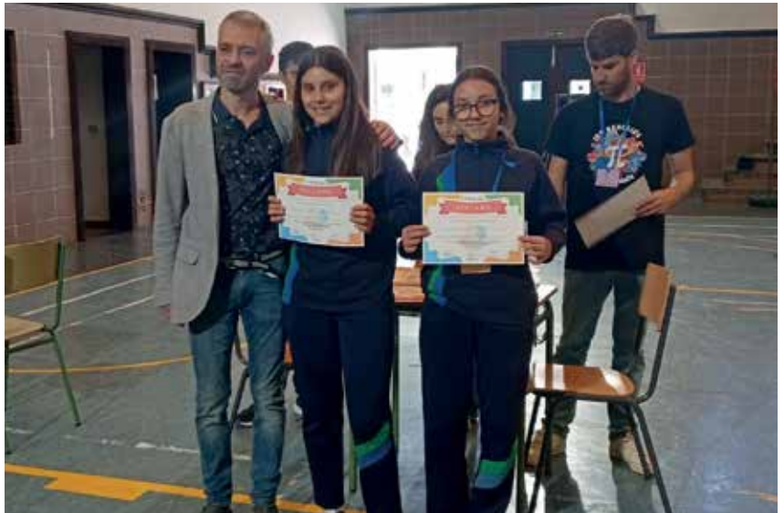
Los Realejos, en el III Torneo de Matemáticas Intercentros. El alumnado de 2º y 3º de ESO participó en mayo en este torneo, que incluyó pruebas de cálculo mental, puzzles en pareja, pensamiento computacional y medición y precisión.