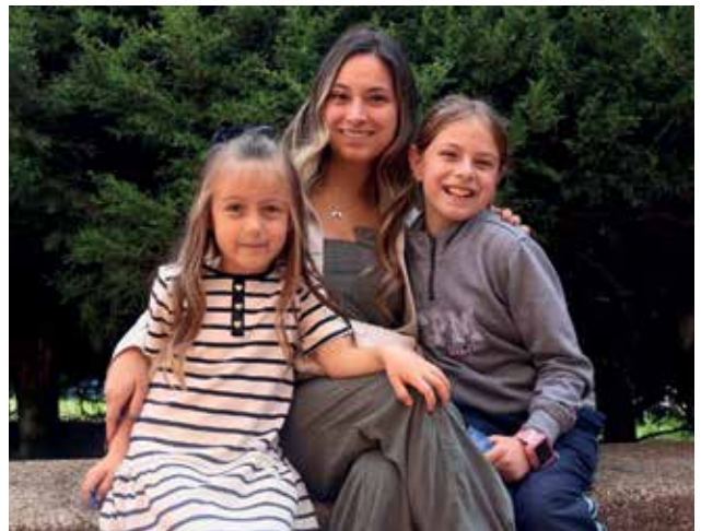
Día de la Madre en Bogotá. Mamás en Pureza de María: gracias por ser guía, fortaleza y luz en la vida de sus hijos.