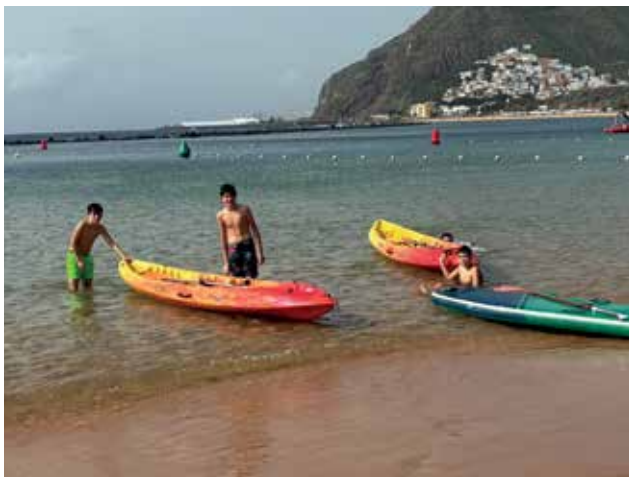
Jornada de deportes acuáticos en Educación Física de 1º de ESO en Santa Cruz. Acercándose en abril a la playa de las Teresitas, con paddle surf, kayak y patines acuáticos con tobogán.