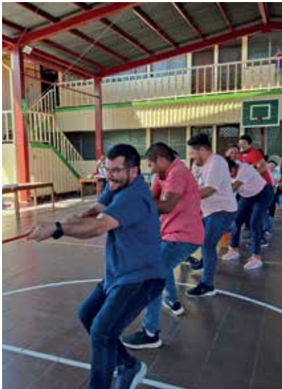
Convivencia con familias en la Escuela Madre Cayetana Alberta. Con padres y madres de primer y segundo grado.