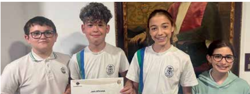
Los consejeros escolares de Inca dan el relevo. Nuestros consejeros de 6º de Primaria dieron por finalizada su labor en el Consejo de la Infancia de Inca. Fue en la sala de plenos del ayuntamiento, donde recibieron su diploma de participación.