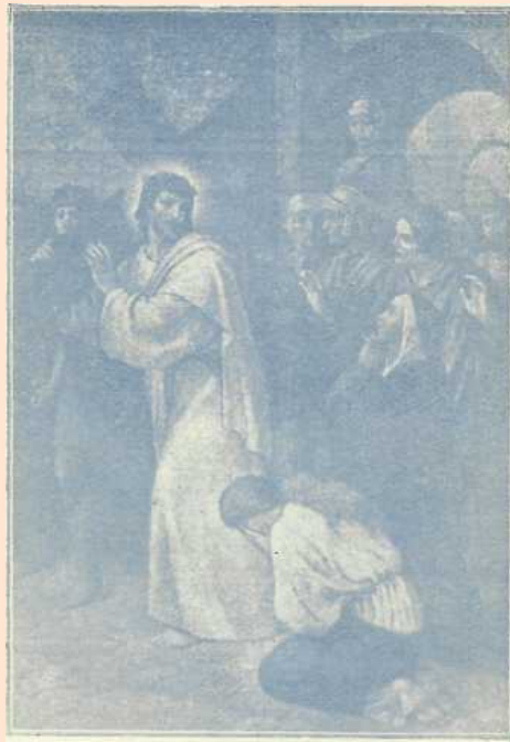
Jesús, consuela a las piadosas mujeres Camino del Calvario.

su libro Cuando estás solo y abandonado a tí mismo no veo más que pensamientos de envidia, egoísmo y ambición. ¿A qué implorar felicidad, si no puedes librarte de las calamidades que te amenazan?.