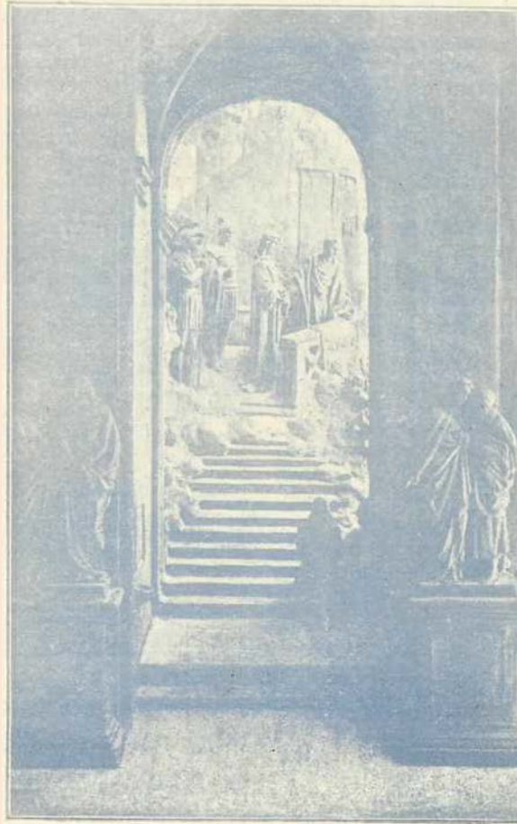
LA S C A L A S A N C T A

Era muy temprano, como las seis de la mañana, -- pero los tribunales se abrían apenas amanecía el día -- y los sanedritas, a quienes no era lícito matar a nadie