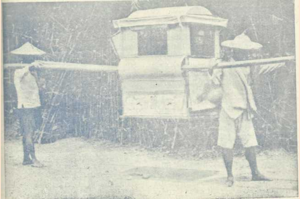
CHINA: VIAJANDO EN SILLA GESTATORIA