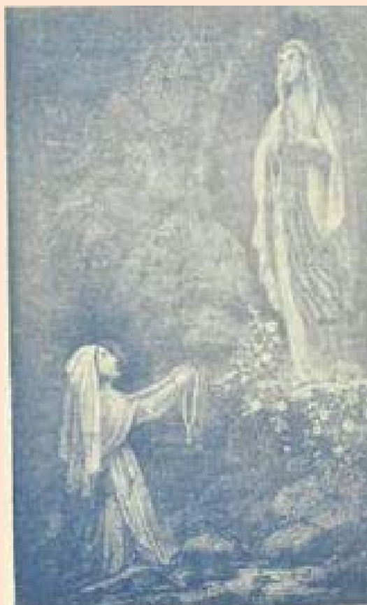
Nuestra Señora de Lourdes