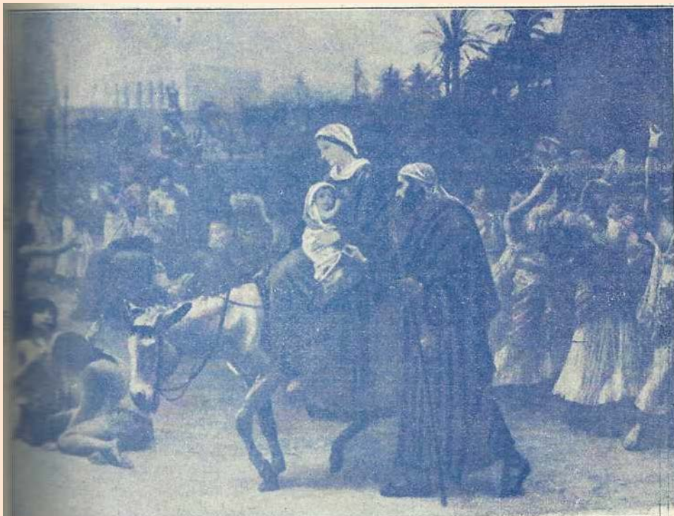
Llegada de la sagrada Familia a Egipto

Así resulta también, la adoración de los Magos, otro prelude, no menos ex-