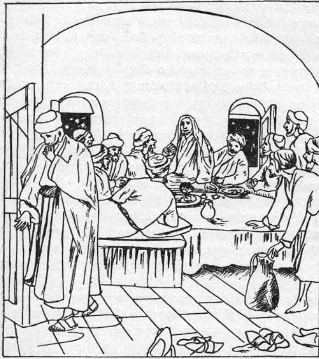
«A la salida del traidor, recobrada... su calma...»

Una cuestión previa, por eso mismo, es la siguiente: Antes de pasar Jesucristo a la institución eucarística celebró la cena legal completa, o bien reunió en su cena en santa mezcla las ceremonias y fórmula de la antigua Pascua?