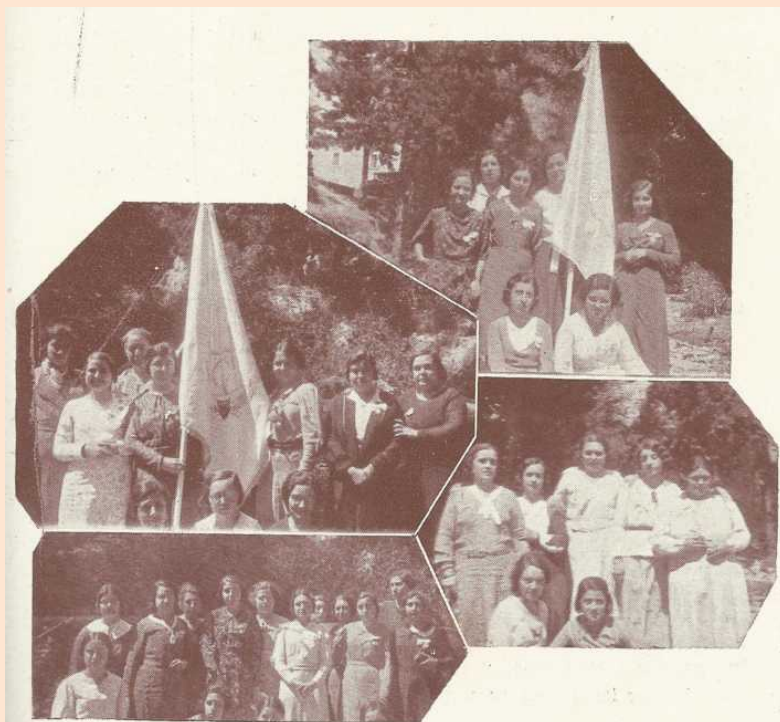
Federadas, Palma - Manacor, con sus respectivos estandartes, que asistieron a la gran Asamblea de Juventud Católica.