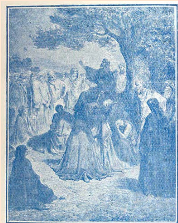
Cristo fue el primer Catequista

todo empero, es común a los cuatro la narración de la Vida de Jesucristo