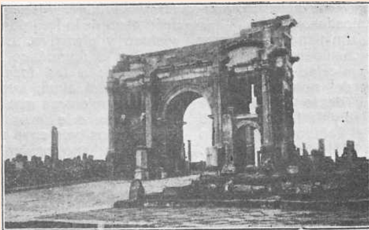
Arc de Trajan. II me siècle.

Je puis satisfaire ta curiosité, chère amie, Oui, l'Afrique est tres riche en ruines Romaines, en Basiliques surtout et qui sont demeurées dans leurs lignes.