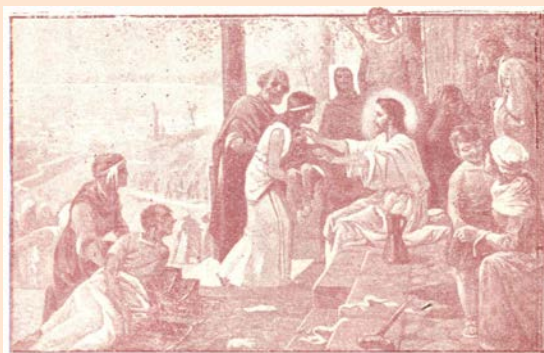
Les hablaba de Reino de Dios y daba salud a los que carecían de ella. ( San Lucas )

Mirad a todos los infelices de este mundo; ciegos y mudos. parálficos y enfermos, huerfanos y moribundos que se alimentan y rejuvenecen en el seguro regazo de la Caridad sublime.--En fin vemos a nuestra heroína en su rasgo ideal, la enseñanza, la educación; el plan de la obra maestro lo trazó el Hombre Dios, y desde entonces siguen los escogidos sus huellas formando