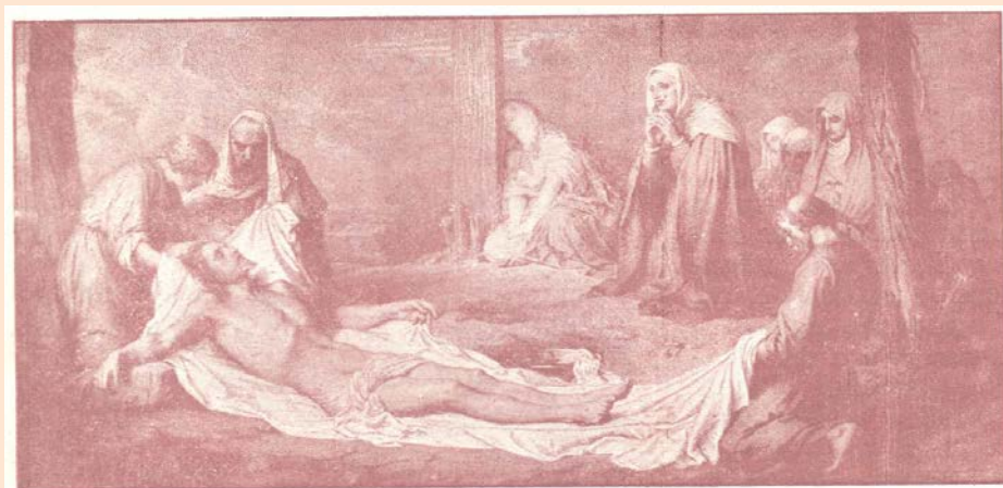
En el Calvario.-- Momentos de intensa aflicción