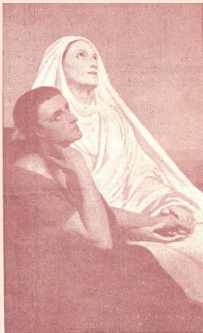
San Agustín y su madre Sta. Mónica

Desprendióse bruscamente de la joven y tomando veloz un sendero se dirigió a su aposento y allí se encerró. Su corazón latía apresurado, era el momento de la gracia, el coloso iba a caer por fin derribado bajo el peso de una fineza de Dios cuando sus ojos enturbiados divisaron blanco pliego sobre la tallada mesa, sus manos temblorosas desdoblaron el papel y la formidable bula de su excomunión apareció a sus ojos con caracteres de fuego.