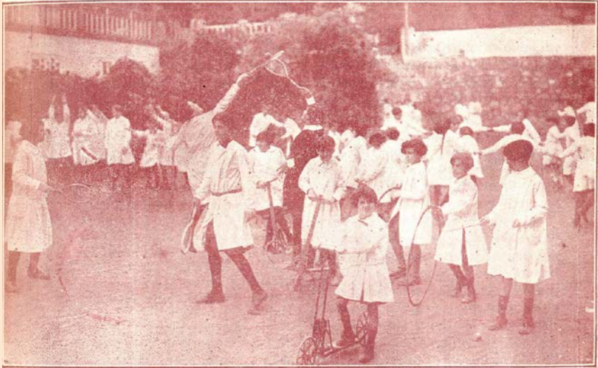
Colegio de Santa Cruz.-- En recreo

De donde quedó el refrán "Esos son otros López.)"