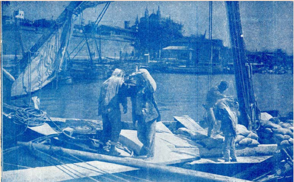
Puerto de Palma

Con gusto artístico van colocándose bolas de color de plata, otras rojas-- verdes -- que brillan entre el verde oscuro-- largas trenzas plateadas se pierden entre las ramas formando di-