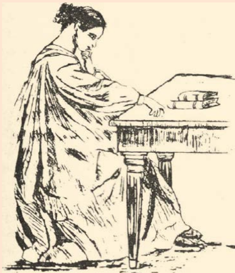
Los libros le recordaban aquellas impías novelas que habían envenenado su corazón

Así pasaba los meses Pilar, siempre triste y melancólica, hasta que por fin obró Jesús en su alma uno de esos secretos milagros transformando su corazón en templo puro, el cual había más tarde de ser el