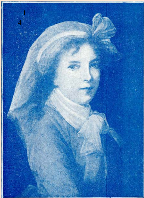
Viginia le Brun. Pintora francesa. Autoretreto