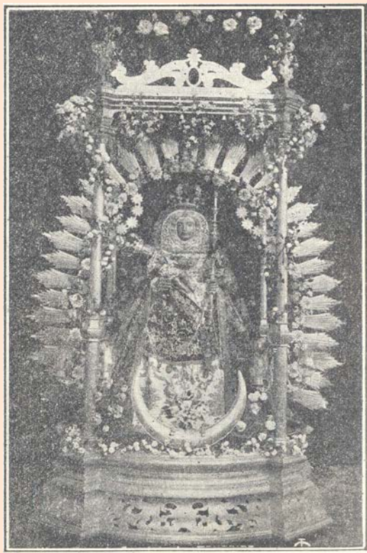
Nuestra Señora de Candelaria.-- Canarias

Como la ley les prohibía, bajo severa pena de muerte, hablar a solas con una mujer en sitios apartados; le hizo se-ña para que dejara libre el pa-so al ganado, sin conseguirlo; irritado, cogió una piedra para obligarla a retirarse, sin conse-guir tirarla, pues el brazo no res-pondióle, quedándosele paraliza-do. Asustado llamó a su compa-ñero y le enteró de lo que pasa-ba, y éste, colérico, se acercó a ella, y al ver su inmovilidad du-dó si sería o no de carne, quiso cerciorarse; cortándole en un de-do, sacó su tabona ( cuchillo de pedernal ) sin lograr a pesar de intentarlo dos veces, herirle en lo más mínimo, mientras que su mano sangraba sin que la imagen sufriera los efectos de las amenazas ni del daño que intentaron hacerle.