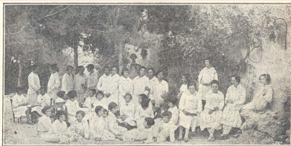
Colegio de Manacor. - Externado