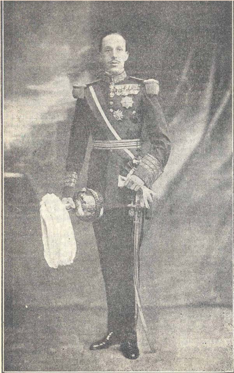
S. M. el Rey Alfonso XIII