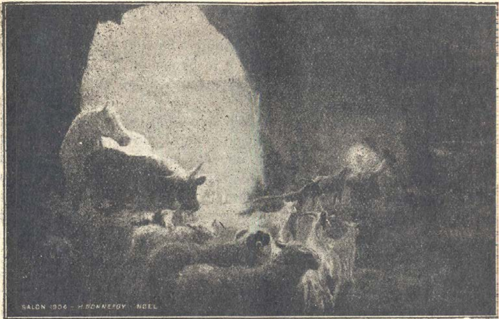
El Nacimiento del Niño Dios ¡ Jesús en una Cueva !

cían ahora silenciosas; la noche era dulce y tibia; la ligera niebla hacía palidecer el resplandor amarillo de los reverberos.