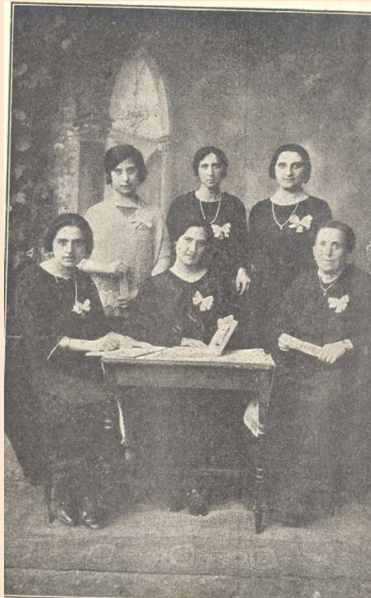
Junta de Alcácer

La primera admira complacida la obra delicada de sus blancas manos que no se han entregado nunca a penosas fatigas.