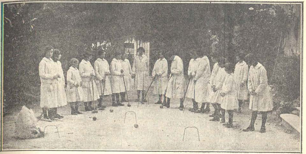
Pensionado de Manacor