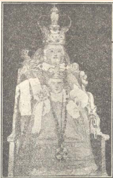
Nuestra Señora de Bonañy ( Petra ), Mallorca

El bellissimo Santuario de Bonañy, situado en la montaña de este nombre, en Petra, todavía no es generalmente conocido y por ese motivo no es tan visitado como se merece; aunque ya lo va pregonando la fama por la afluencia de pe-