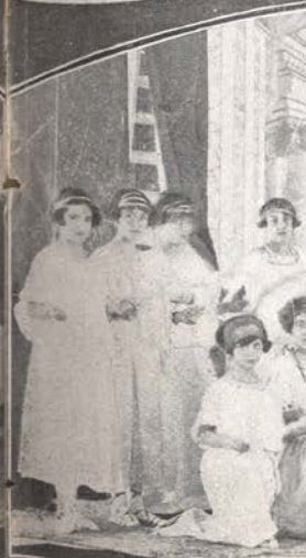
Colegio de Santa Cruz - VELADA LITERARIA : La Princesa de Cornuail Representada por las alumnas del Pensionado