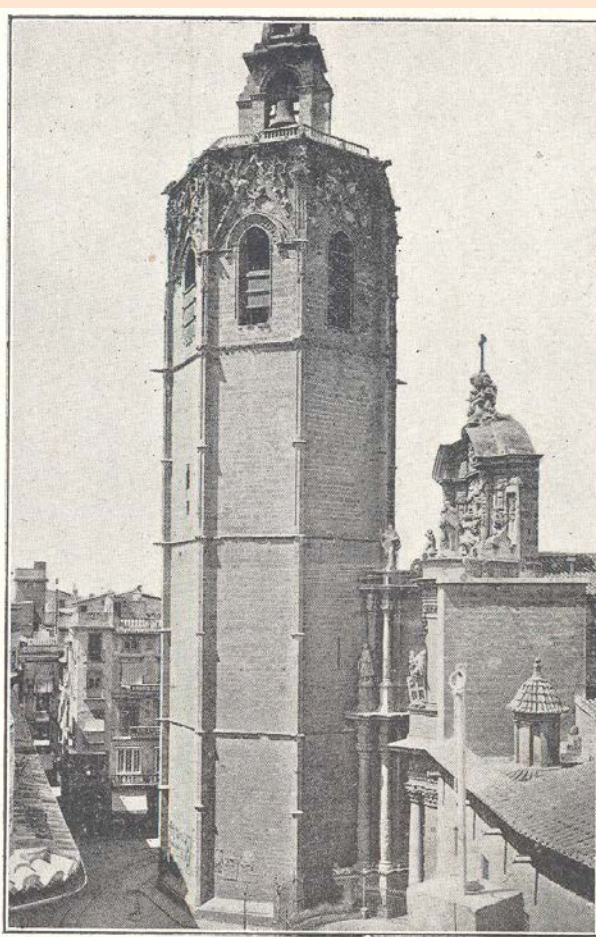
Torre Miguelete. -- Valencia