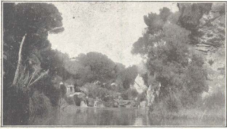
Torrente Cañamel.-- Capdepera

L'esglaidora bellesa el cor deixa desfallit, a davant tanta grandesa se sent l'homo tant petit !