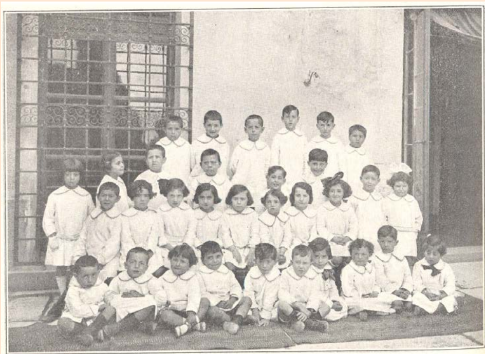
PARVULITAS DE JUMILLA

Entre morada y rojiza quedó un color plateado, como un lirio sonrosado en el que el sol se desliza.