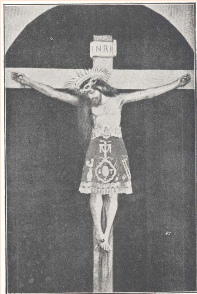
EL SANTO CRISTO DE MANACOR

de la hora señalada para dar comienzo, está el templo completamente lleno haciéndose imposible penetrar en él.