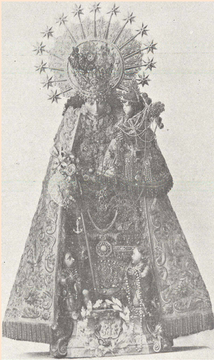
LA VIRGEN DE LOS DESAMPARADOS, PATRONA DE VALENCIA