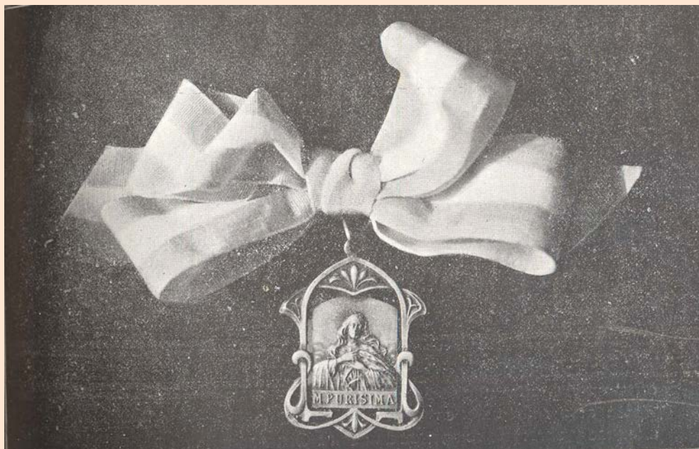
LAZO DE SEDA Y MEDALLA DE PLATA, DISTINTIVO DE LAS FEDERADAS