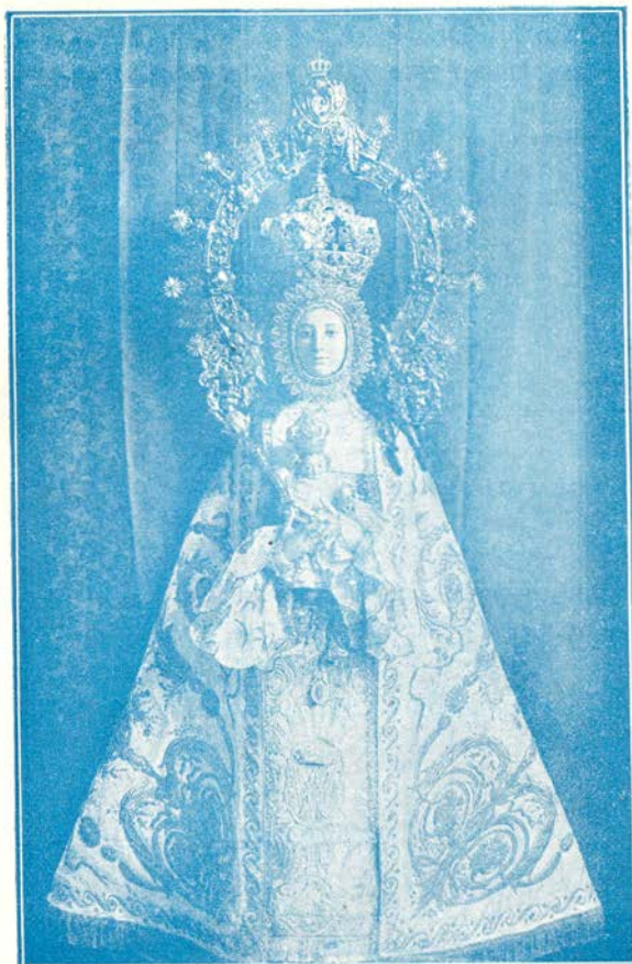
Ntra. Sra. de Belén.-- Patrona de Almansa.