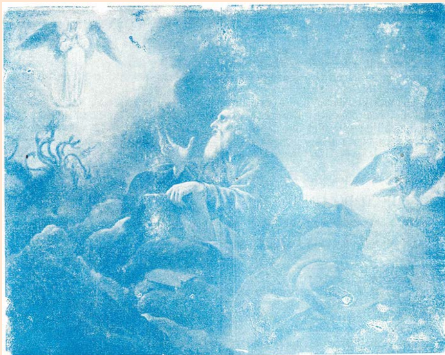
Visión apocalíptica: Muller amicta sole...

ta al corazón la tarea de enviar suficiente sangre al cerebro; y ésta no tarda en recibir toda la que necesita, haciendo que el paciente vuelva en sí y si el corazón no está completamente agotado, la vida se restablece de nuevo. Vemos, pues, que la caída que sigue al desmayo es el medio de que la naturaleza se vale para "salvar la situación". .