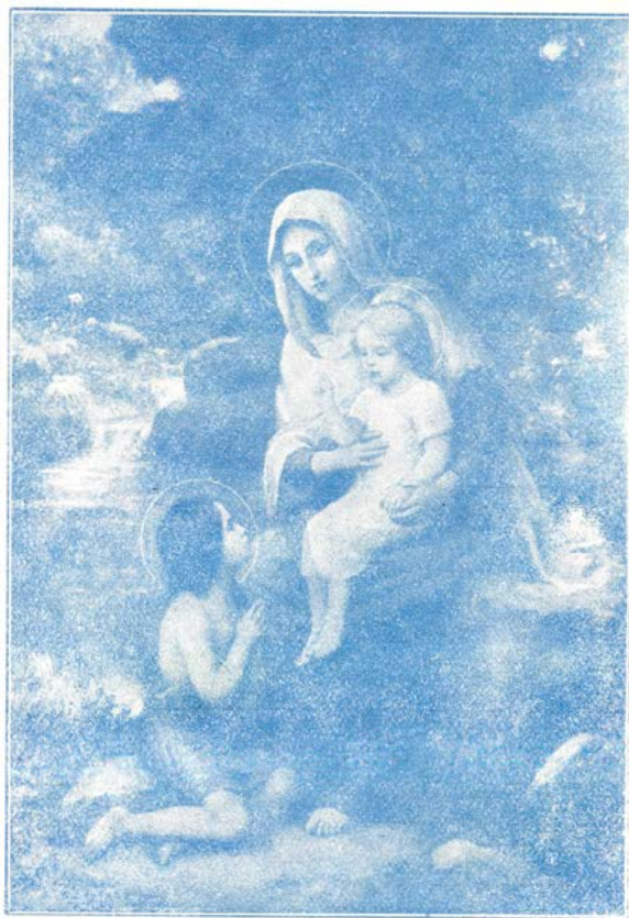
MATER MISERICORDIA. -- E. Azambre