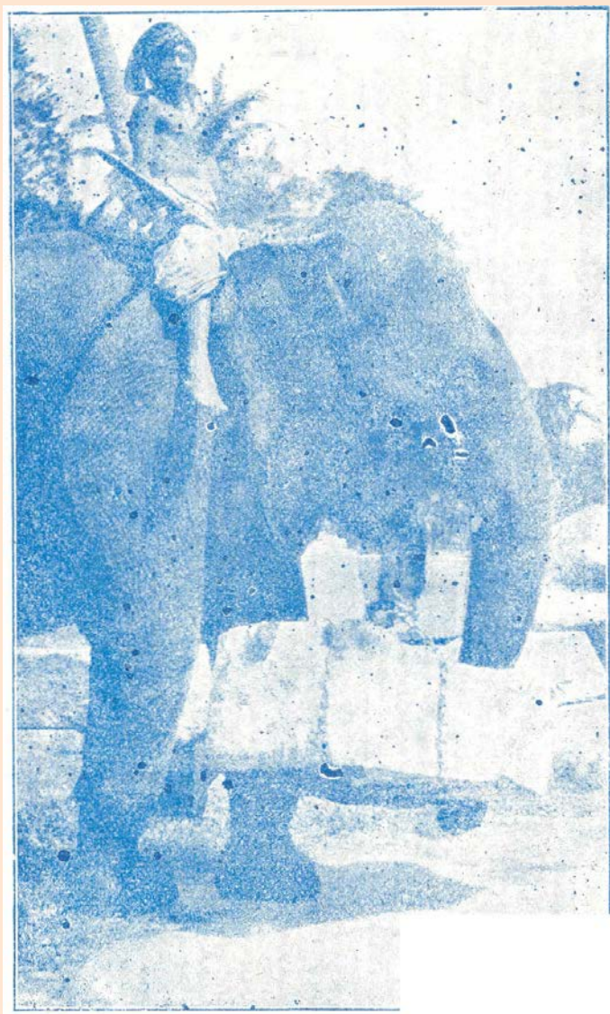
Elefante trabajando dóclmente en el transporte de piedras