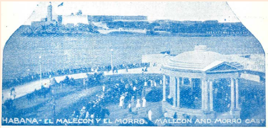
... el Morro la bandera agitada por el viento...

der con su conducta que estaba de más dirigirse a ellos. Uno solo, algo pariente y que por la confianza y afecto que le había dispensado el desaparecido fabricante, tenía moralmente alguna obligación de interesarse por las huérfanas. Después de algunos ofrecimientos, se limitó a enviar a su hijas todas las tardes para hacerlas compañía, y cada tarde, al llegar a la triste casa, como obedeciendo a una