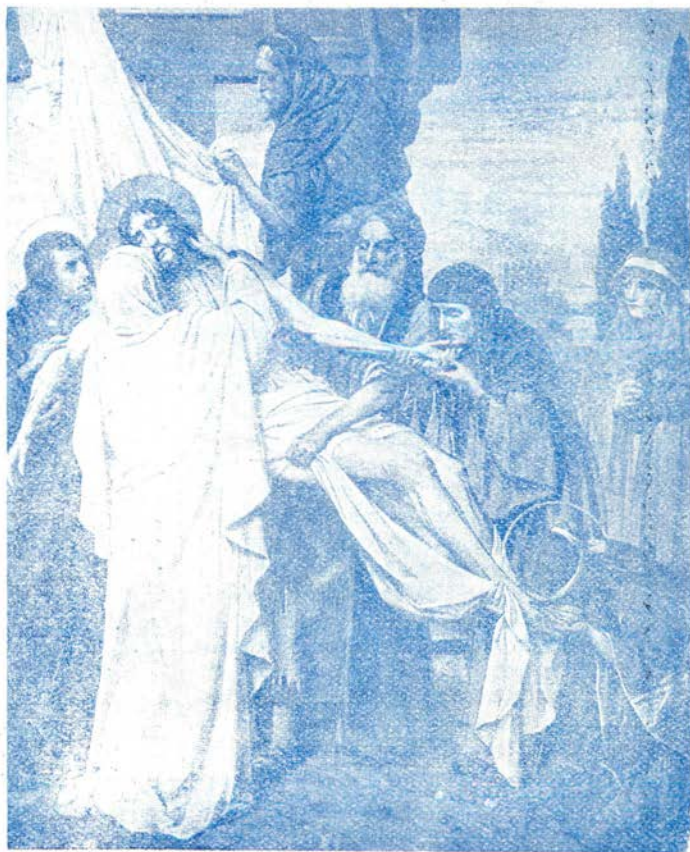
Pintura de José Janssens de los siete Dolores de María. Catedral de Amberes